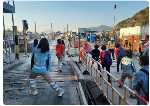
工地辦公室安全培訓

我們任命應急小組確保對不同類型的危害作出恰當應變措施。為應對惡劣天氣、滑坡或洪水、傳染病和中暑等突發情況,我們就上述緊急情況制定應急方案。有關計劃須定期審核,以應對需要進行的額外程序以確保在面臨緊急情況時職業安全的任何重大更新。