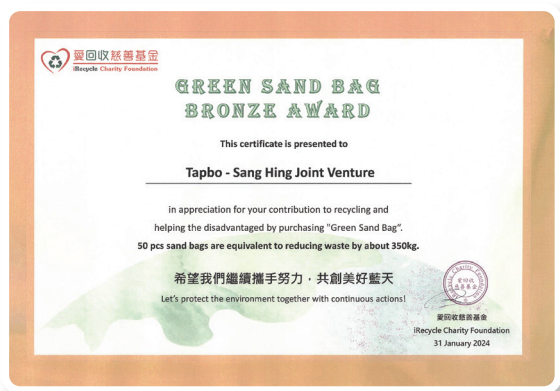
愛回收慈善基金綠沙包銅獎

本集團的努力得到了獎項及榮譽的認可。於報告期間內，本集團成功獲得愛回收慈善基金綠沙包銅獎及第29屆公德地盤嘉許計劃（工務工程—新建工程）優異獎。